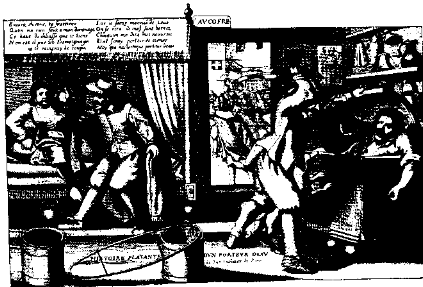
2. - Streghe che fanno festa. Incisione su legno di Hans Weiditz. 3. - Gli adulteri scoperti. Stampa francese del 1600.