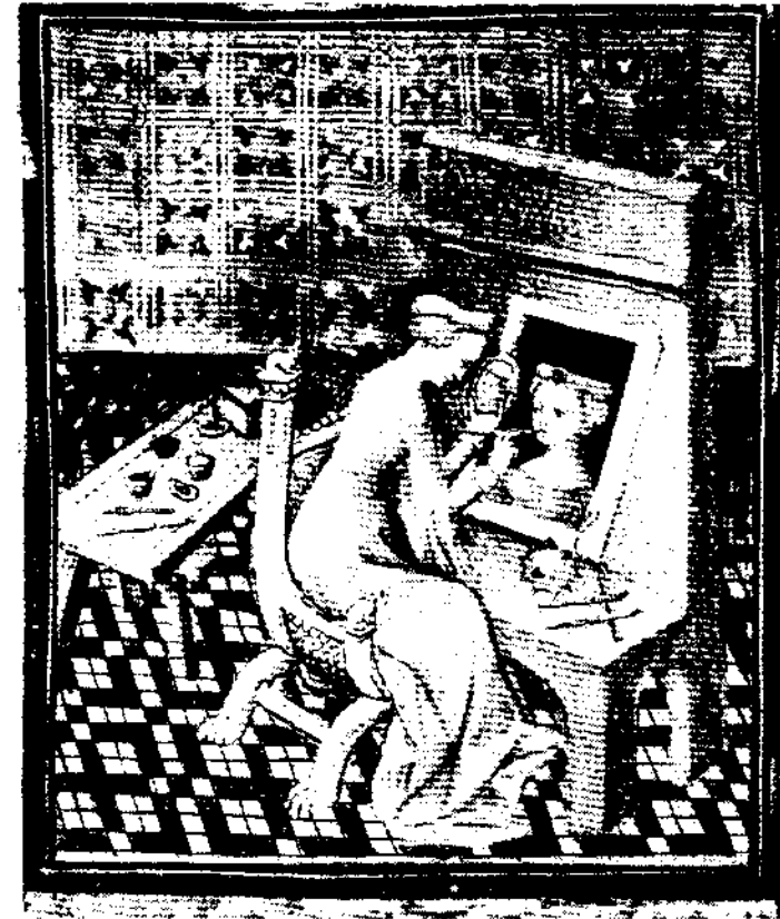
1. - Miniatura attribuita da alcuni alla famosa Anastasia e tratta dal De casibus virorum illustrium di Giovanni Boccaccio.